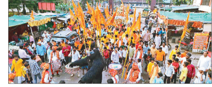
शोभा यात्रा में शामिल नगरवासी।

में सवार किया गया। शोभायात्रा भगवान परशुराम मार्ग, सक्ती मार्केट, शांती चौक, पोस्ट ऑफिस मार्ग, आजाद चौक अंबेडकर चौक होते हुए श्री राम चौक में पहुंची। शोभा यात्रा का नगर वासियों ने भव्य स्वागत किया। शोभायात्रा के दौरान युवाओं द्वारा डीजे की धुन पर नृत्य किया गया। शोभायात्रा में हनुमान जयंती के अवसर को झांकी आकर्षण का केंद्र रही। शोभायात्रा के श्री राम चौक में पहुंचने पर भगवान श्री राम एवं हनुमान की पूजा अर्चना करने के साथ मंगल आरती की गई। नगर के लोगों द्वारा श्री राम चौक में सुंदरकांड एवं हनुमान