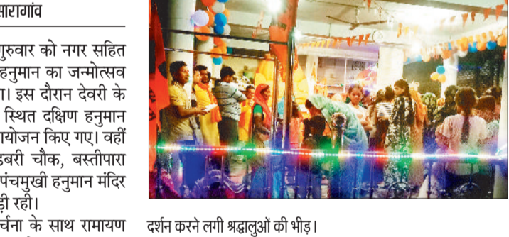
दर्शन करने लगी श्रद्धालुओं की भीड़।

भक्तों ने मंदिरों में पहुंचकर पूजा-अर्चना के साथ रामायण पाठ, सुंदरकांड पाठ और भजन-कीर्तन का आयोजन किया। शाम के समय महाआरती में बड़ी संख्या में श्रद्धालु शामिल हुए। मंदिरों की फूल-मालाओं और रंग-बिरंगी लाइटों से आकर्षक ढंग से सजाया गया था, जिससे पूरा वातावरण भक्तिमय बना रहा। कई स्थानों पर हनुमान जी की शोभायात्रा भी निकाली गई, जिसमें बैंड-बाजों, झांकियों और जयकारों के साथ श्रद्धालुओं ने उत्साहपूर्वक भाग लिया। देवरी के ब्यास चौक हनुमान मंदिर में भक्तों ने नारियल, रोट, चना, गुड़, बूंदी, जलेबी, अंगूर, केला,